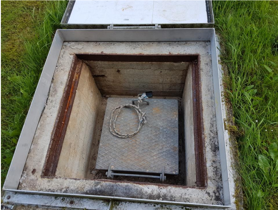
Adgang til rentvandstank